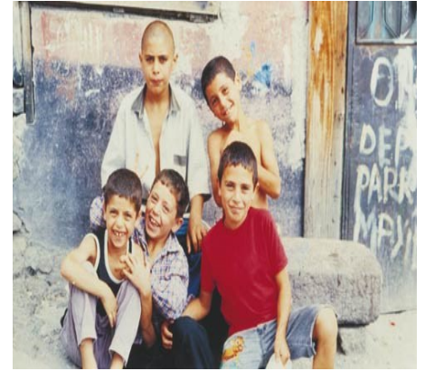
Türkiye (2002) UNICEF Evrensel Çocuk Hakları Sözleşmesine Göre Tüm Çocuklar Eşit Haklara Sahiptir.