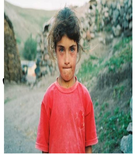
Kars'ın kırsal bölgesinde bir kız çocuğu (UNICEF 2004)